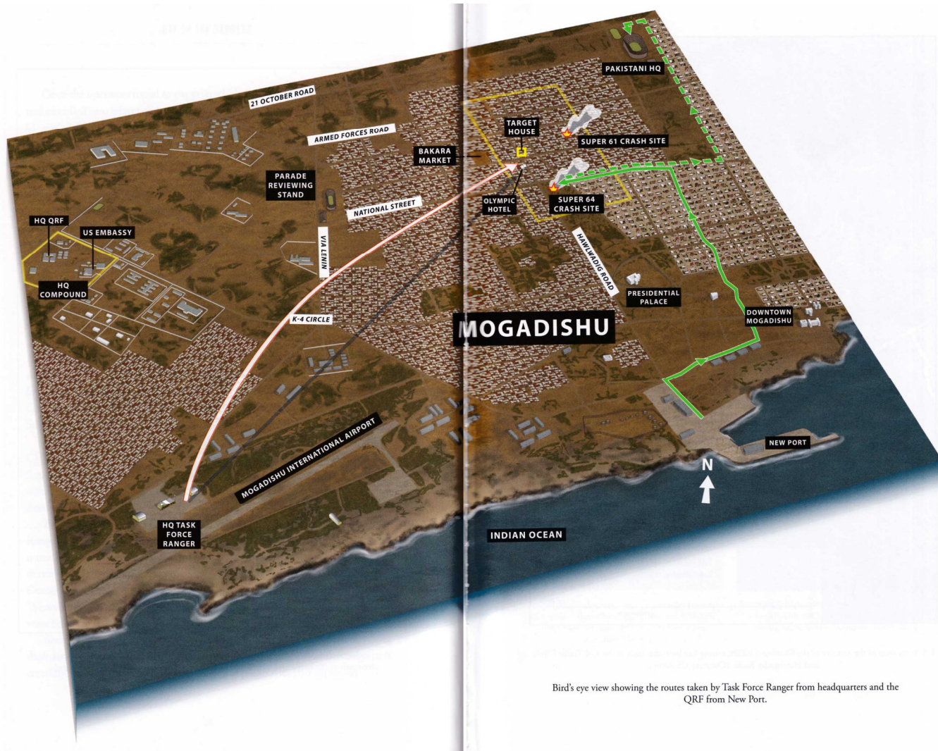
Bird's eye view showing the routes taken by Task Force Ranger from headquarters and the QRF from New Port.