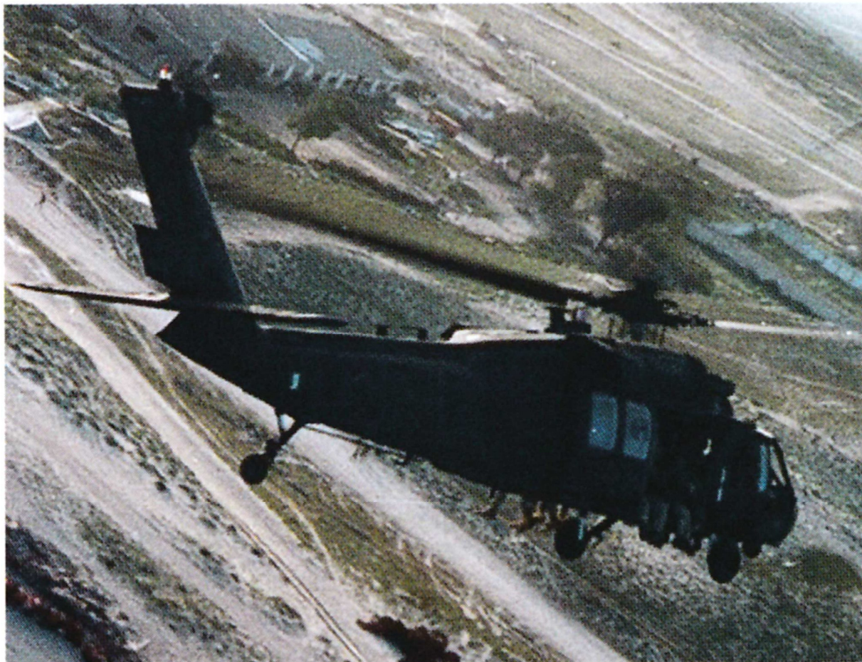
"Супер 64" (фото сделано из "Супер 65") на пути к цели перед 3 октября. Обратите внимание на сидящих в дверях Рейнджеров.