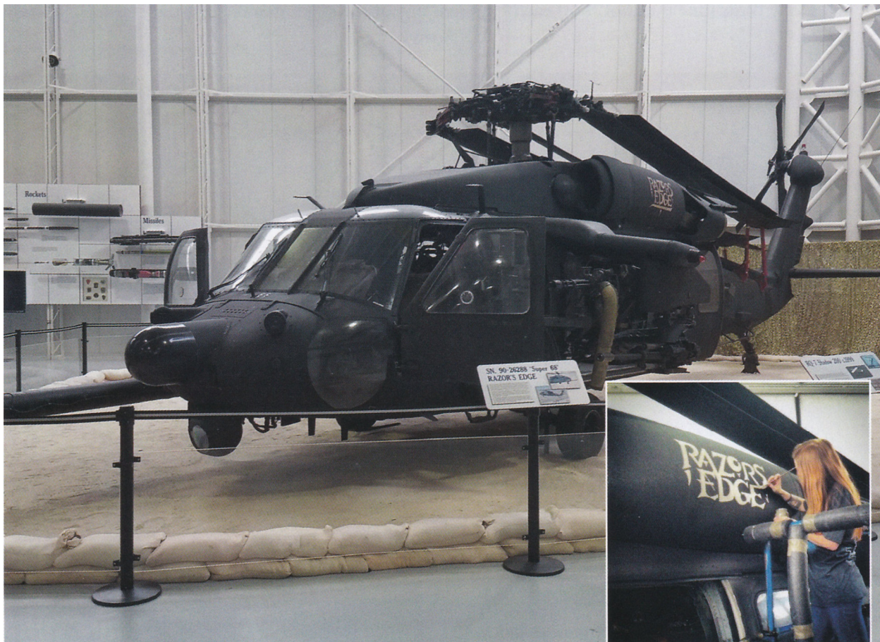
"Супер 68", вертолет CSAR в экспозиции музея армейской авиации в Алабаме. "Супер 68" продолжал служить в 160-м и летал в Ираке и Афганистане в качестве "прорывателя прямого действия" (Direct Action Penetrator – DAP), вооруженного варианта MH-60. (Музей армейской авиации США). На врезке: Реставрационные работы, проведенные на "Супер 68" в музее армейской авиации включали восстановление знаменитой надписи "Лезвие бритвы". (Музей армейской авиации США)