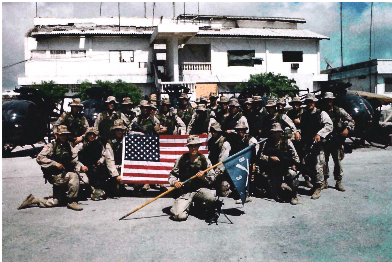
Часть роты "Браво" 3-го батальона Рейнджеров у ангара. В здании позади них находились ЈОС и разведотдел. Обратите внимание на сложенные лопасти несущих винтов "Маленьких Птичек". (75-й полк Рейнджеров)