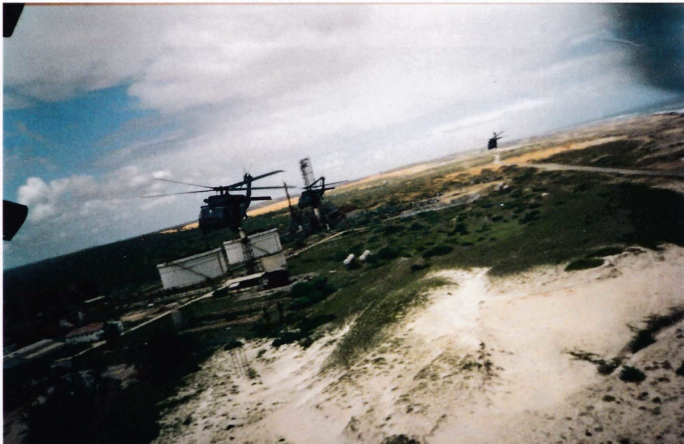
Сделанное из "Супер 64" во время одной из предшествующих задач над пригородами Могадишо фото летящих позади "Блэкхоков" "Супер 65", 66 и 67.