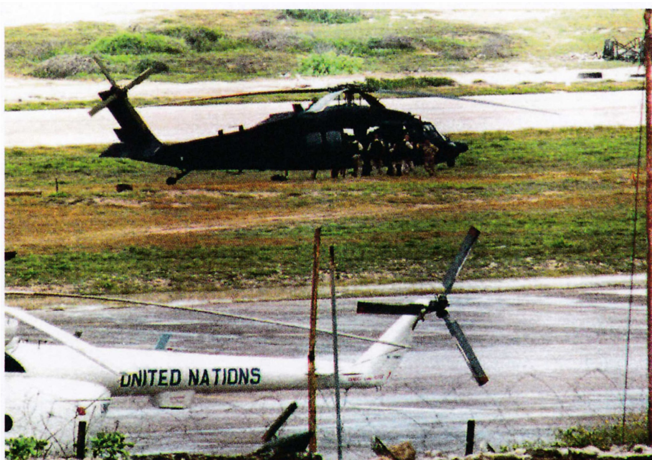
Несколько неопознанных членов оперативной группы "Рейнджер" возле МН-60 160-го в международном аэропорту Могадишо 28 августа 1993 г. К сожалению, качество фото слишком плохое, чтобы различить номер "Блэкхока".