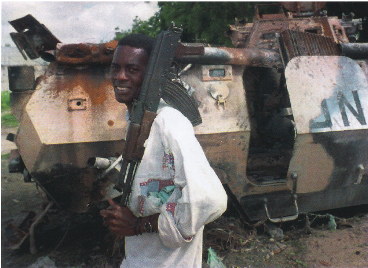
Вооруженный АК47 ополченец рядом со сгоревшим малазийским бронетранспортером "Кондор", по всей видимости, одним из двух, отколовшихся от основных сил, когда спасательная колонна ООН прибыла на Хальвадиг в ночь с 3 на 4 октября.