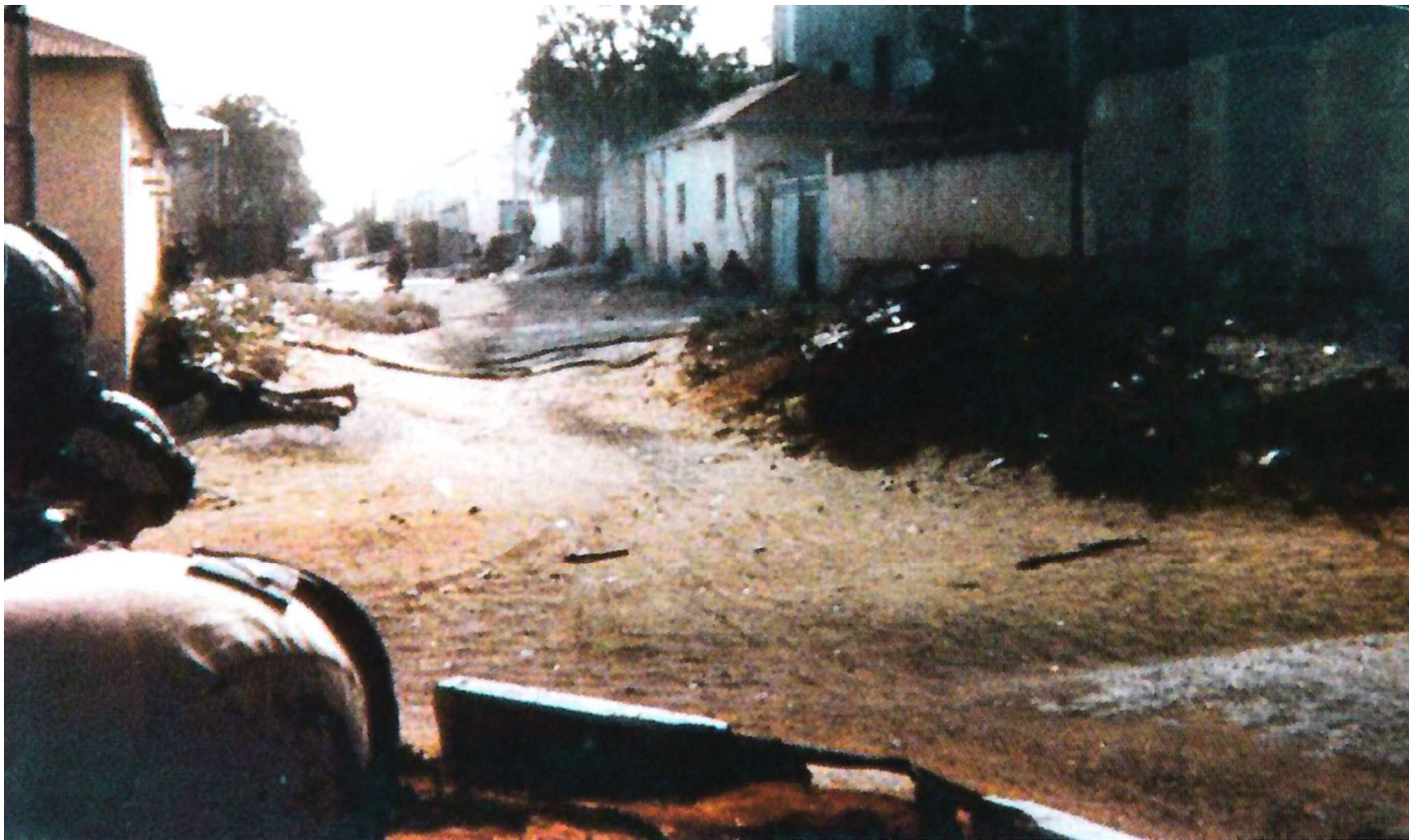
Единственное известное фото, сделанное на земле в ходе битвы, снятое с местонахождения "Мелка 1" на юго-восточной блокирующей позиции. Вид вдоль стены, окружающей здание цели. На заднем плане, на перекрестке с Хальвадиг-роуд виднеется "Мелок 3" Тима Уотсона. Также видны ворота во двор, сквозь которые врывалась "Дельта" (окрашенный голубым участок стены). Над ними виднеется часть здания цели.