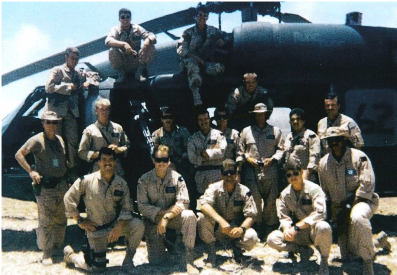
1-й летный взвод роты "D" 1-го батальона 160-го SOAR позирует на фоне "Супер 62". Трое из присутствующих на фото авиаторов трагически погибли 3 октября 1993 г. (Джерри Иззо)