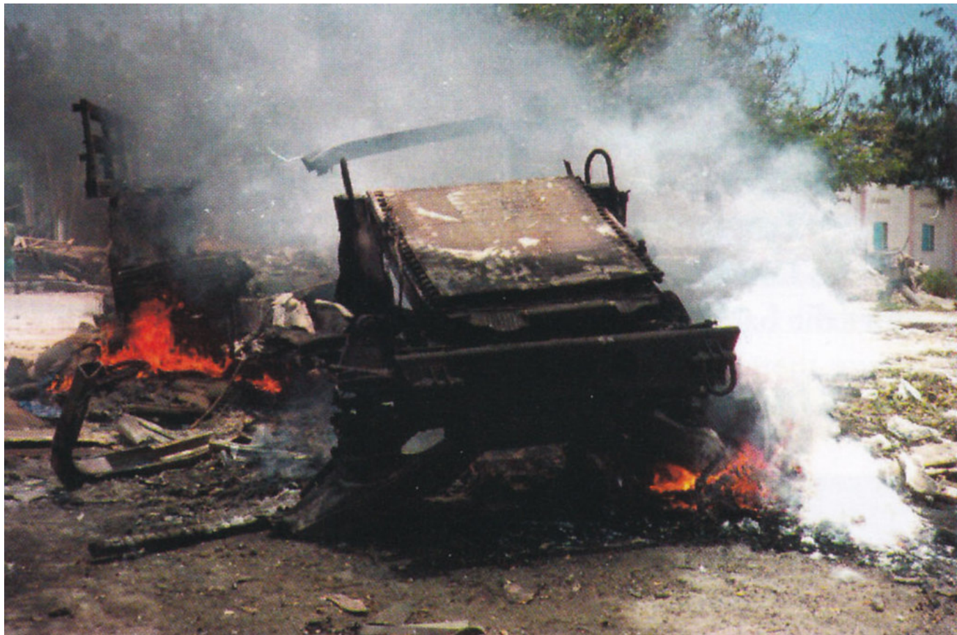
Обломки грузового Хамви оперативной группы "Рейнджер" после того, как он был брошен возле кольцевой развязки К-4 и подожжен с помощью термитных гранат операторами "Дельты".