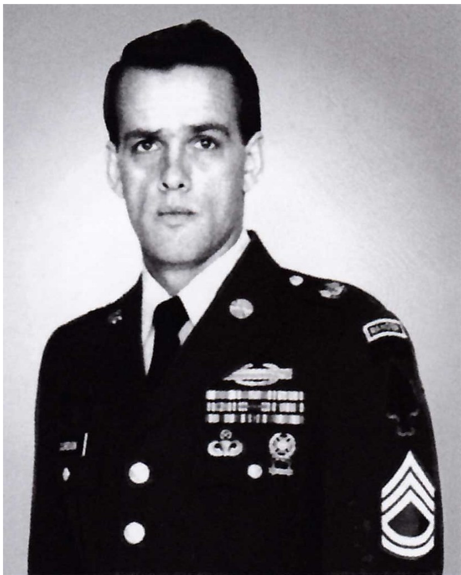
Мастер-сержант Гэри Гордон, отдавший свою жизнь, обороняя место крушения "Супер 64" и посмертно награжденный Медалью Почета Конгресса: "Экстраординарными героизмом и преданностью долгу мастер-сержант Гордон поддержал высочайшие традиции военной службы и заслужил великую честь себе, своему подразделению и Армии Соединенных Штатов".