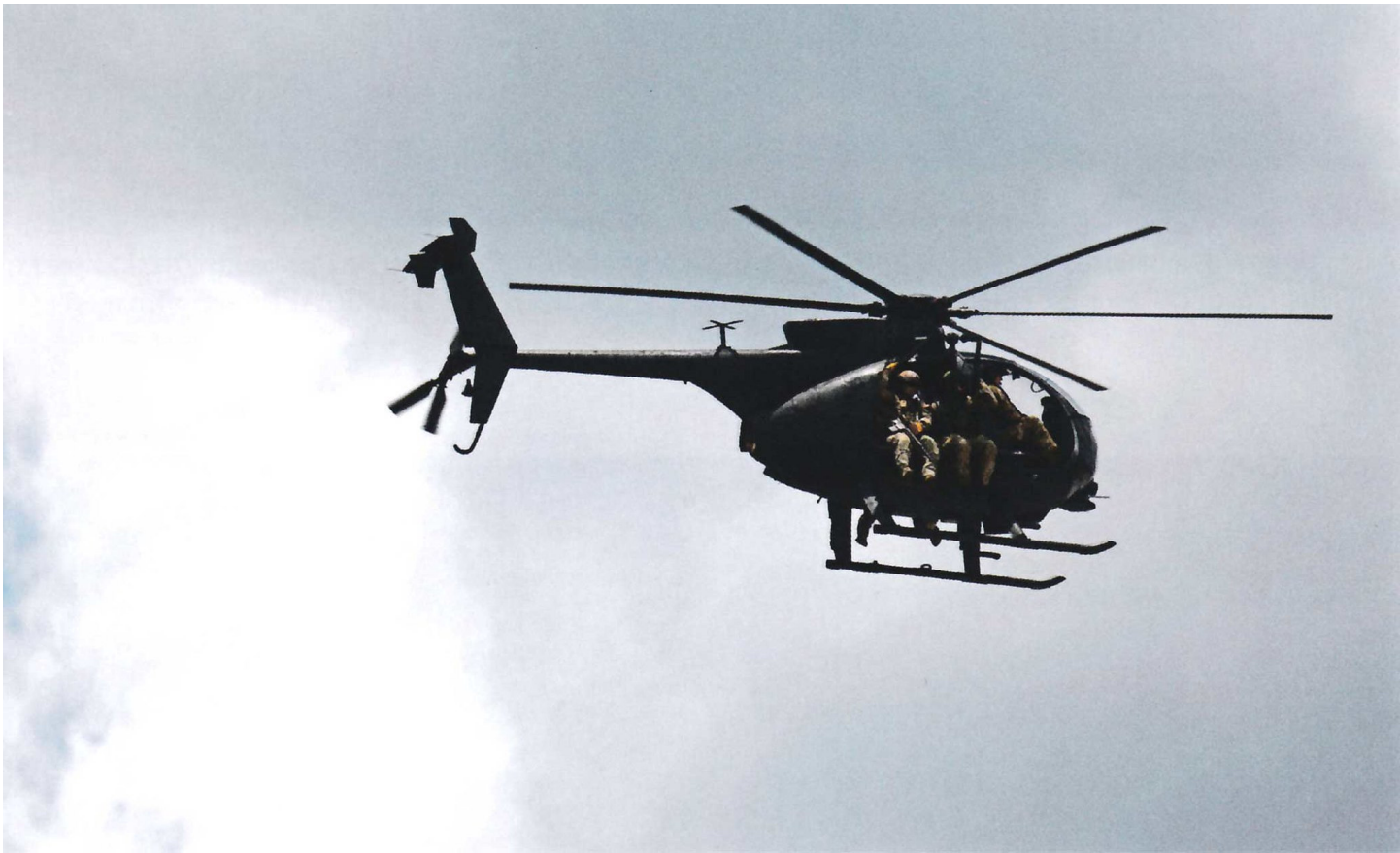
Фотография современной "Маленькой Птички" МН-6, на которой хорошо видны "людские подвески" и кронштейны крепления спусковых канатов.