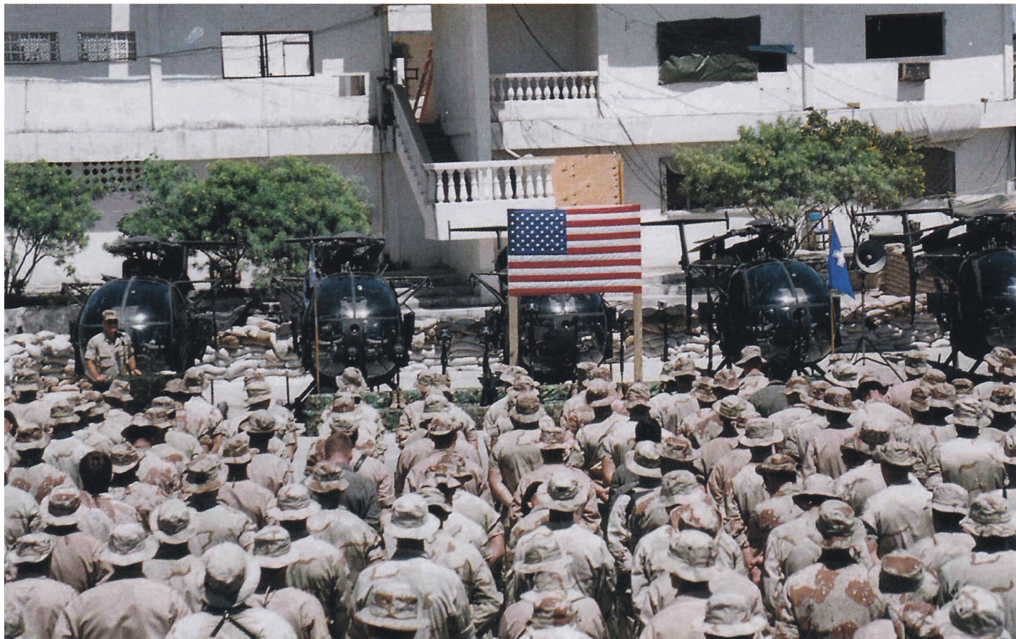
Генерал Гаррисон возглавляет поминальную службу по павшим в бою 3 октября. (75-й полк Рейнджеров)