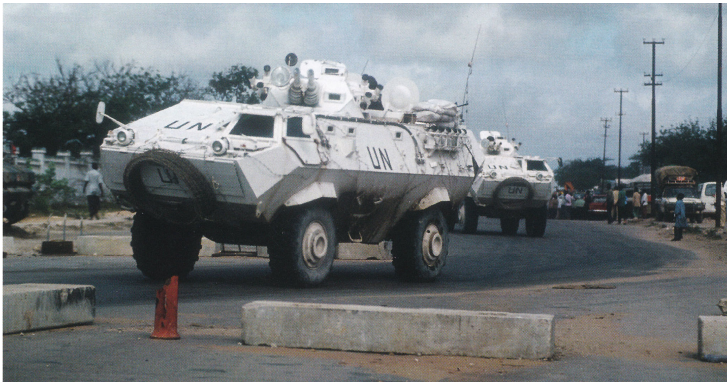
Малазийские бронетранспортеры "Кондор", окрашенные в белый цвет ООН в Могадишо 13 октября 1993 г. Обратите внимание, что оба вооружены спаренными 20-мм пушками вместо более привычных пулеметов FN MAG.