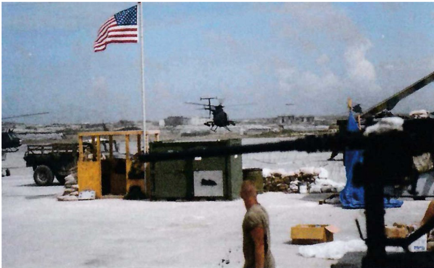
Звено "Барберов" AH-6 (вооруженные "Маленькие Птички") взлетает с аэродрома 3 октября. Каждый вертолет был вооружен парой блоков 2,75-дюймовых неуправляемых ракет и двумя 7,62-мм миниганами.