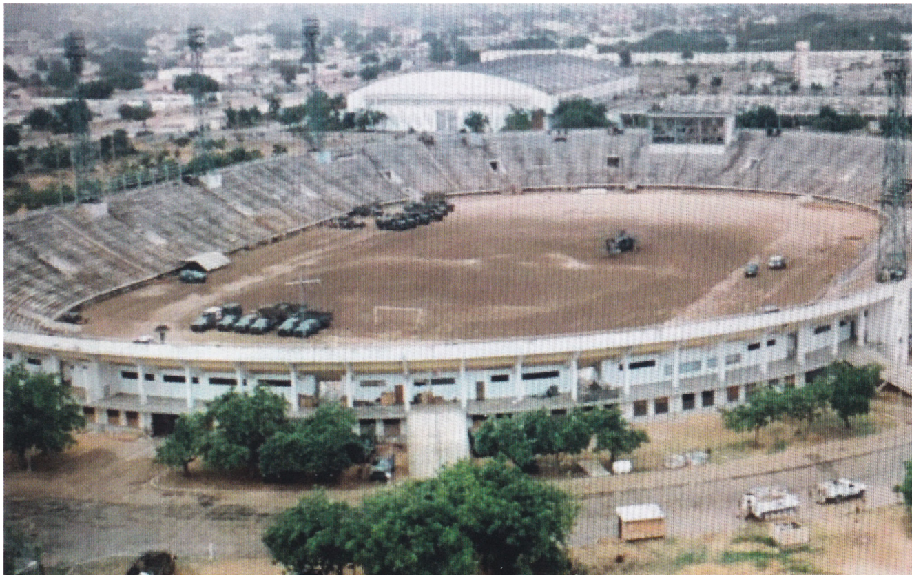
Нечеткое фото контролируемого пакистанцами стадиона, на который в конечном счете оперативные группы "Рейнджер" и "Дэвид" вышли после боя. (Джерри Иззо)