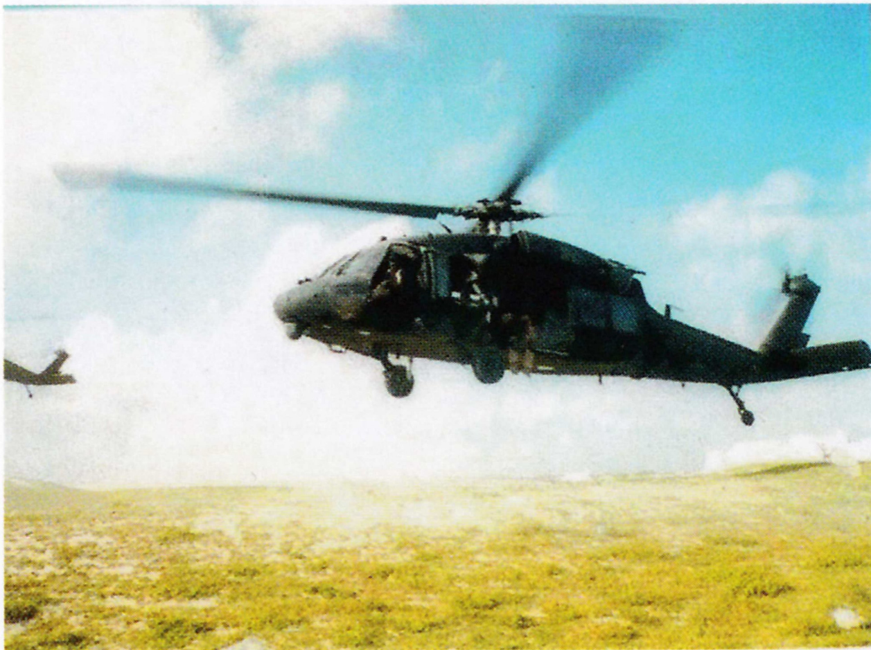
"Супер 65" под управлением капитана Ричарда Уильямса и старшего уорент-офицера 3-го класса Джерри Иззо выполняет тренировочную задачу перед 3 октября. (Джерри Иззо)