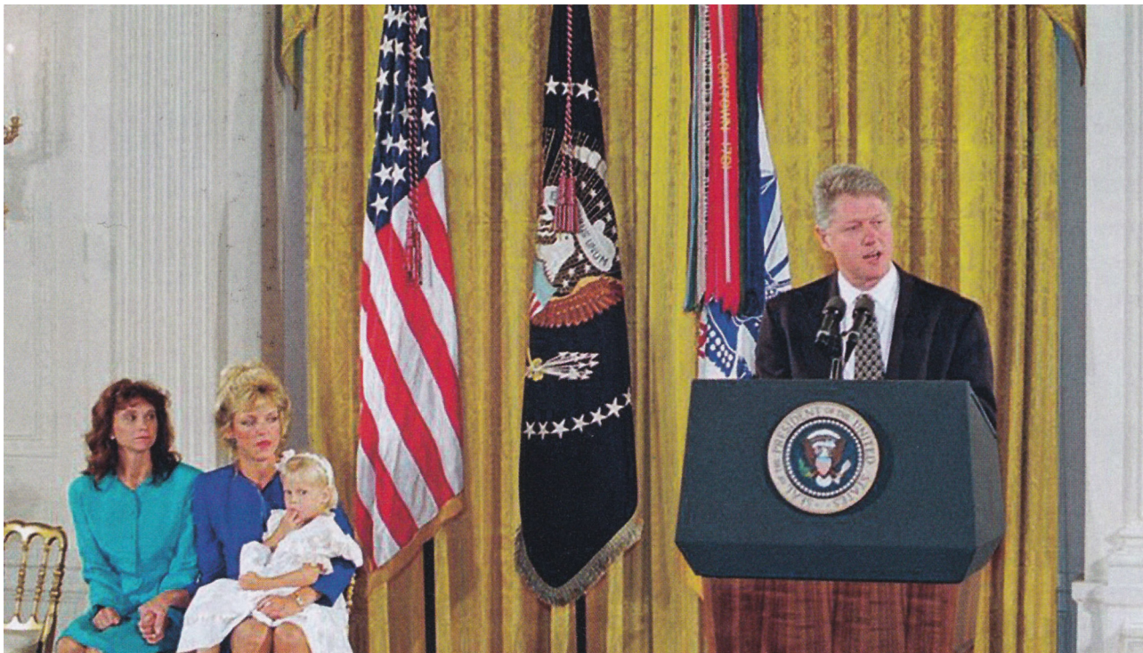
Президент Билл Клинтон вручает Медали Почета Конгресса вдовам Рэнди Шугарта и Гэри Гордона.