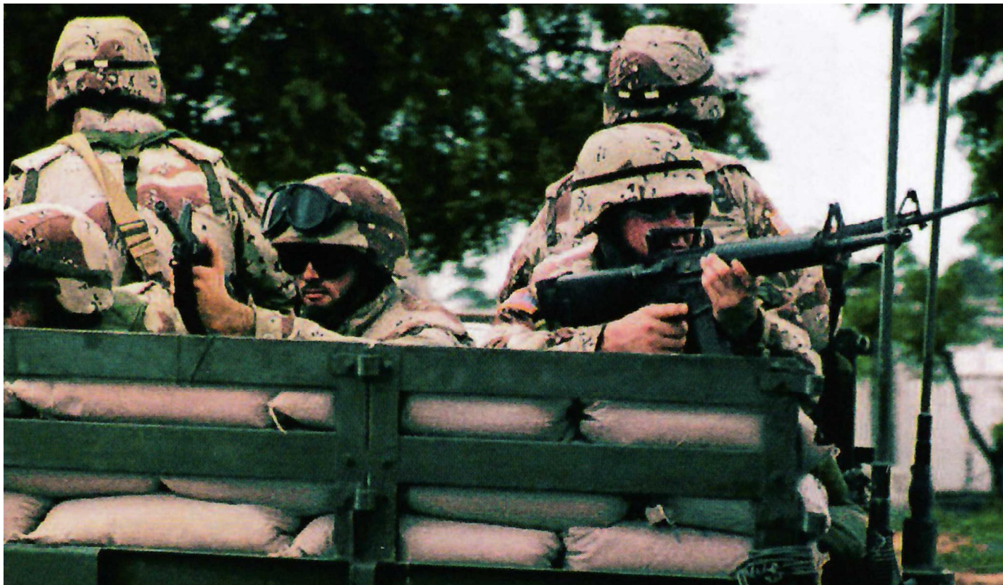
Американские солдаты в Могадишо в кузове 5-тонного грузовика M923A2. Точно такие же, с такой же импровизированной защитой из мешков с песком, использовались оперативной группой "Рейнджер" для вывоза пленных с объекта.