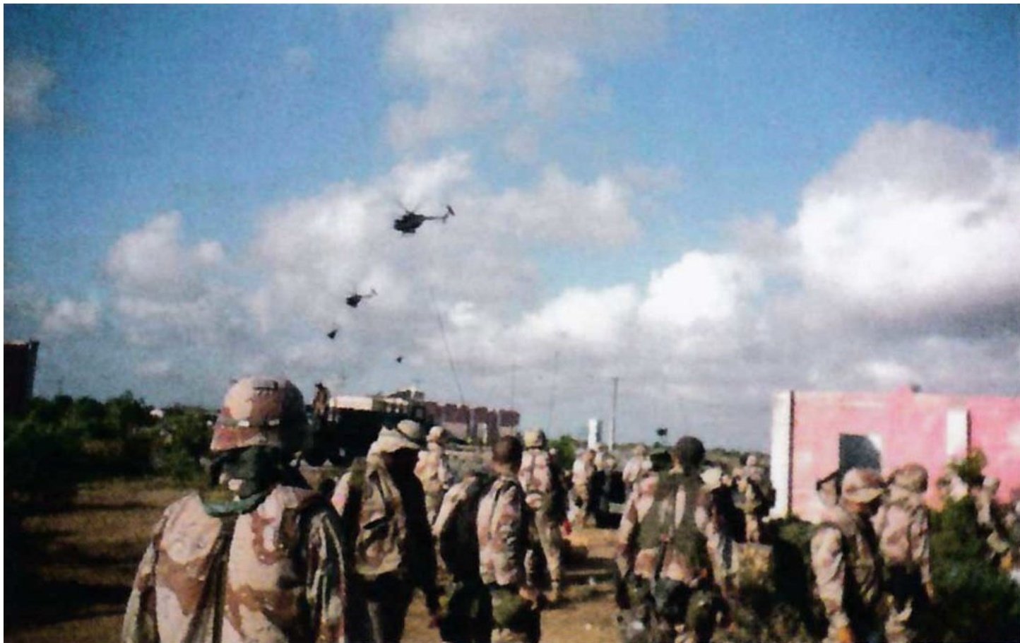
Звено "Звезд" МН-6 (невооруженных "Маленьких Птичек" с наружными скамьями для размещения операторов "Дельты") взлетает с аэродрома 3 октября.