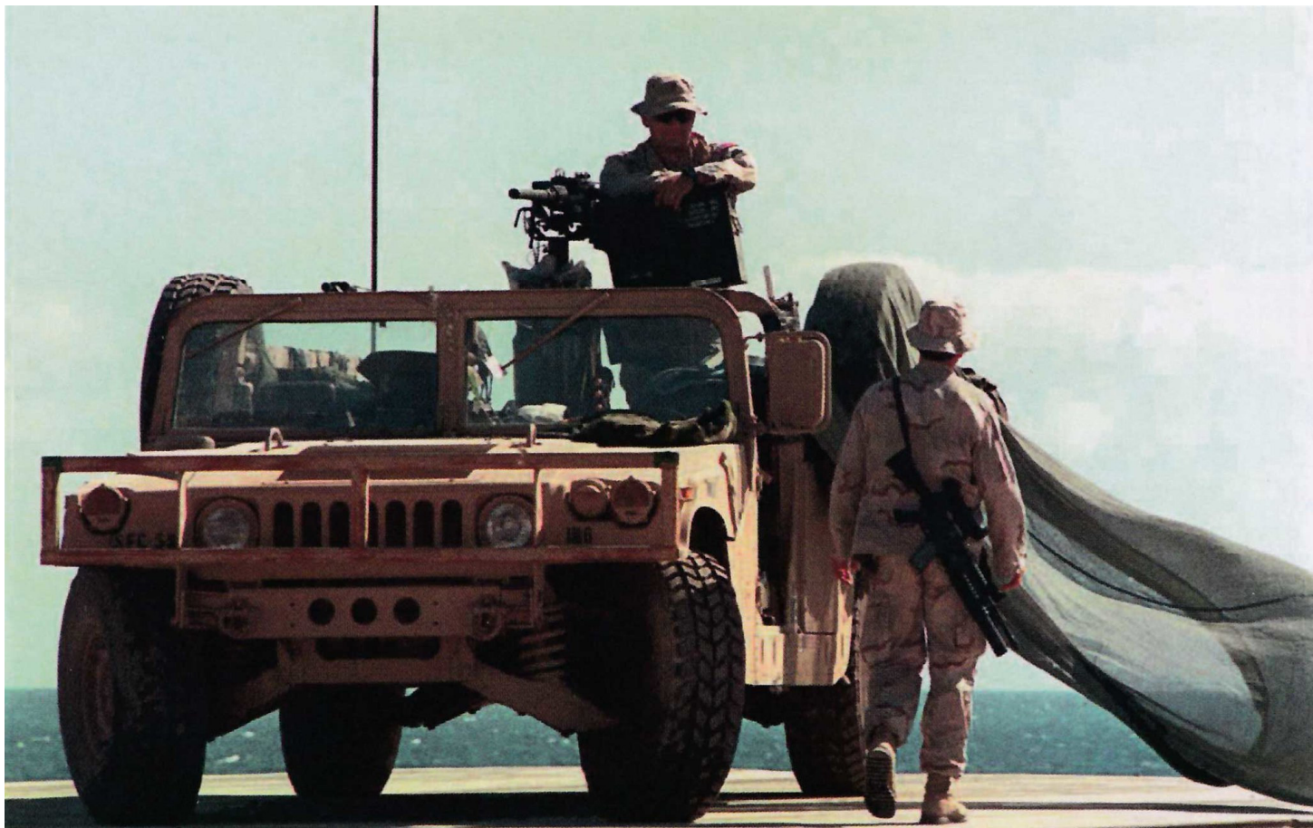
Грузовой Хамви (или "Катви", как его окрестили SEAL) в Новом порту Могадишо. Данная конкретная машина принадлежала 5-й Группе Сил спецназначения, однако она совершенно такая же, как и те, что составляли часть наземных сил быстрого реагирования оперативной группы "Рейнджер".