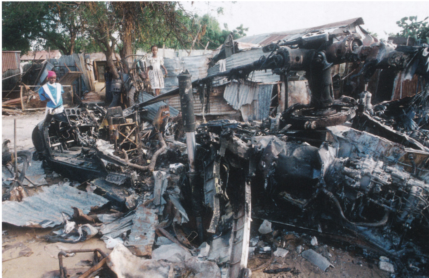
Другой вид места упокоения "Супер 64" и последнего боя Шугарта и Гордона. Обратите внимание на дерево на заднем плане – это было, по всей вероятности, место, куда поместили Дюранта, рядом с находившимся справа от него жестяным забором, сквозь который он стрелял из своего MP5.