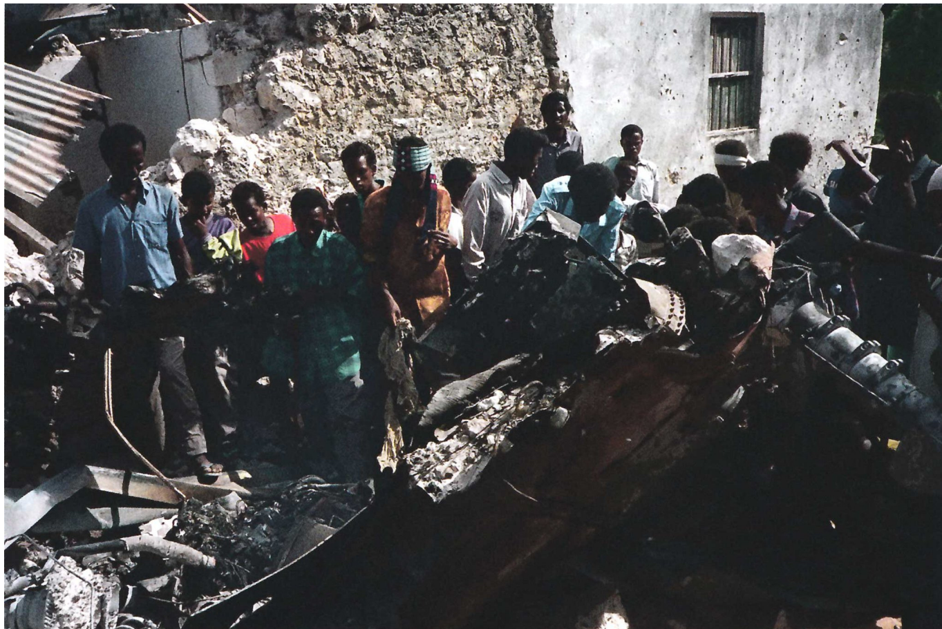
Останки "Супер 61" после уничтожения с помощью зарядов, заложенных взрывотехником Эскадрона "D". Обратите внимание на обрушенную стену на заднем плане слева, часть разрушений, причиненных при падении вертолета в переулок.