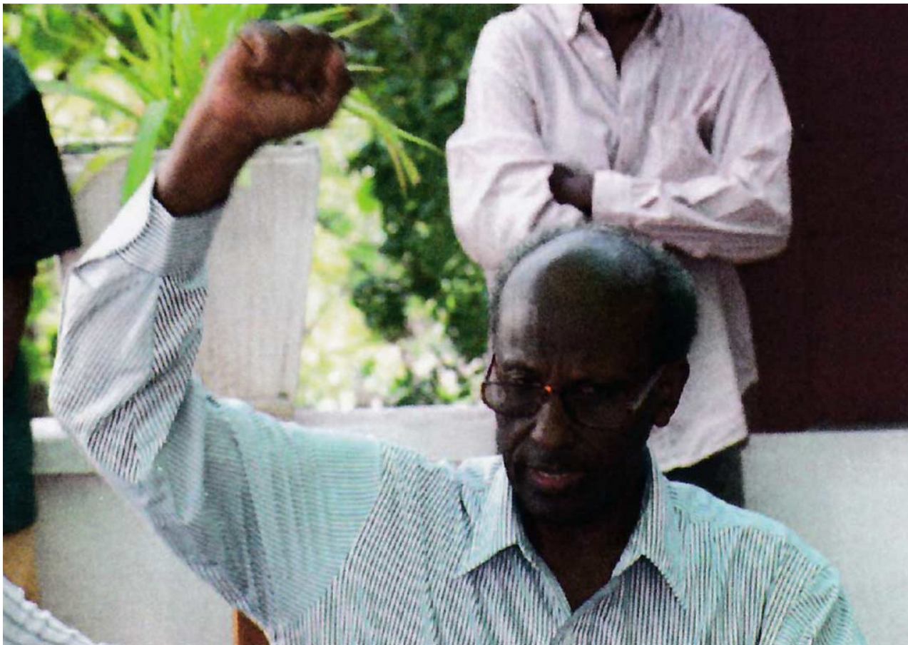
Генерал Мохамед Фара Айдид. Фото сделано незадолго до рейда на дом Абди 15 июня. Примечательно, что до прибытия оперативной группы "Рейнджер" Айдид часто появлялся на публике, поддерживая своих сторонников.