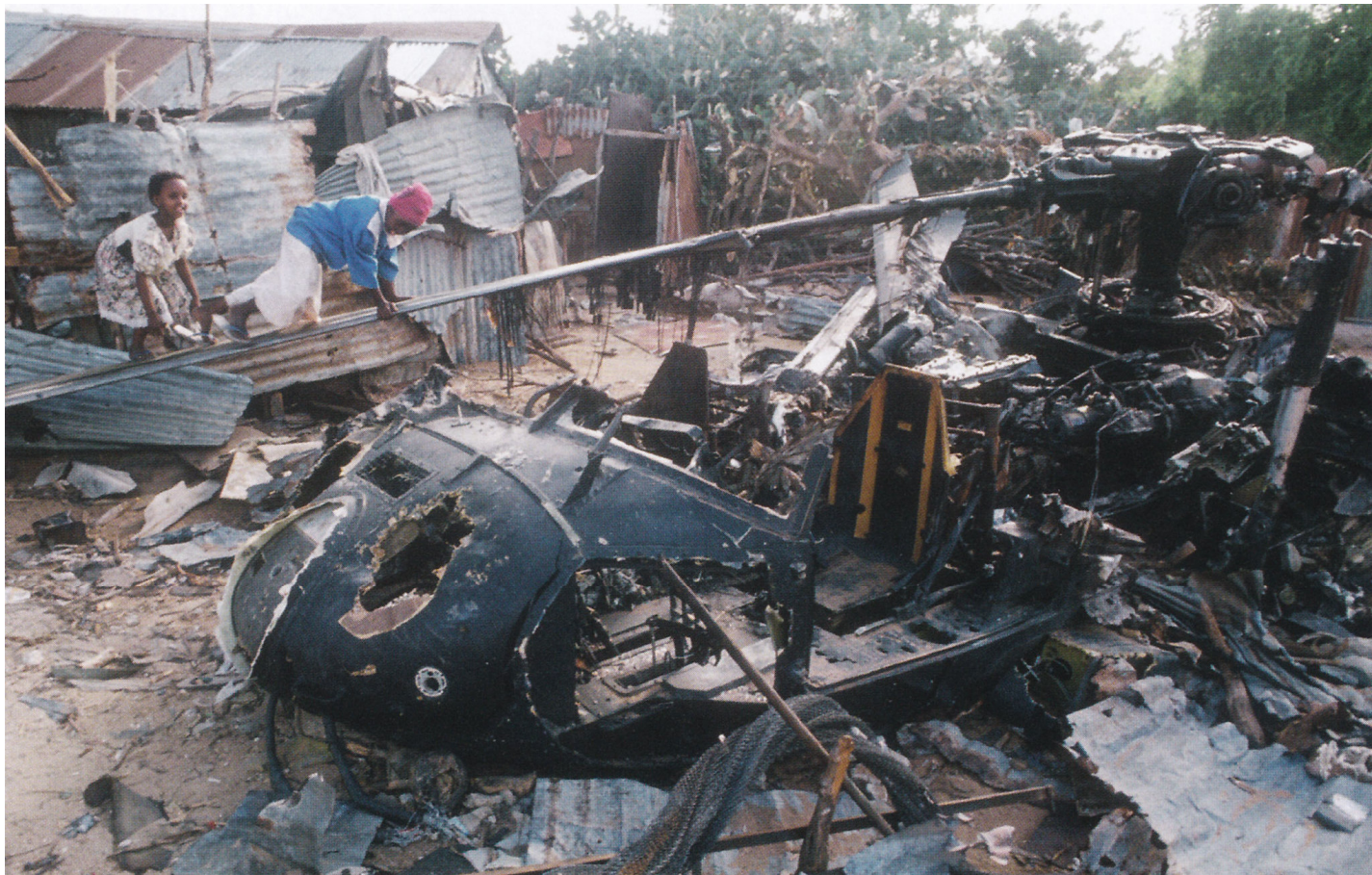
Сделанное 14 октября 1993 г. фото детей, играющих на лопастях винта среди останков "Супер 64" после того, как он был уничтожен термитными гранатами, заложенными операторами "Дельты" утром 4 октября. Обратите внимание на окружающие лачуги.