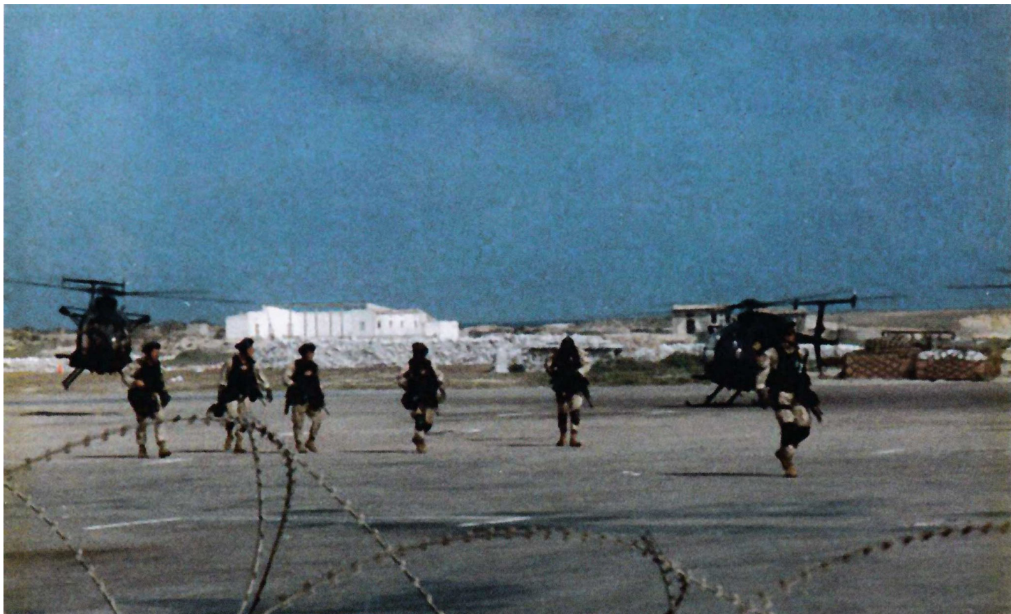
Операторы "Дельты" возвращаются в ангар с одной из предшествующих задач. На двух "Маленьких Птичках" установлены "людские подвески" (официально Система внешнего размещения личного состава – External Personnel System), также видны кронштейны крепления спусковых канатов (Fast Rope Insertion/Extraction System – FRIES)