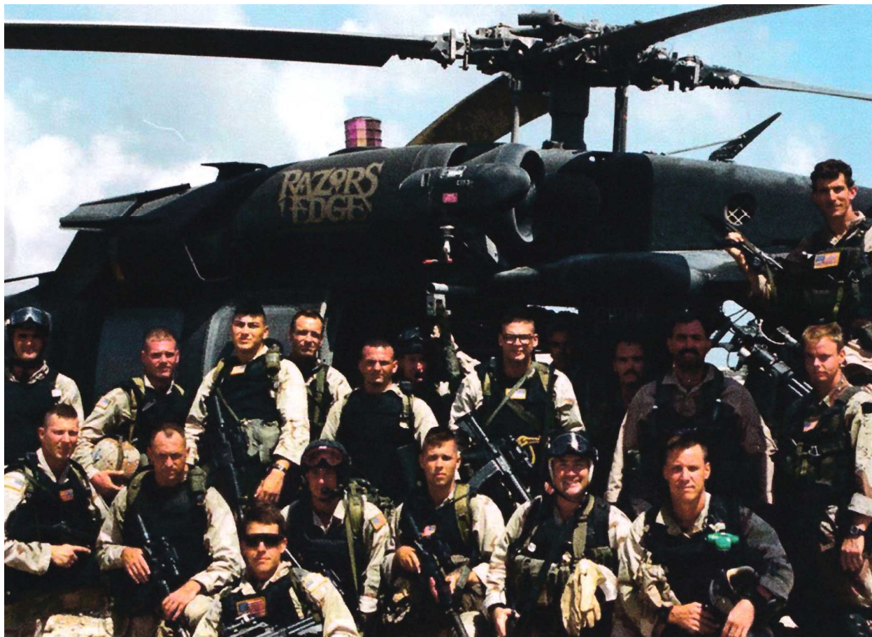
Поисково-спасательная группа (CSAR) позирует перед своим вертолетом "Супер 68" "Лезвие бритвы" (Razor's Edge). Видна разница между бронежилетами Progressive Technologies и броней "Фауст" "Дельты". Обратите внимание на шлемы ProTec и очки, используемые операторами. (Джон Белман)