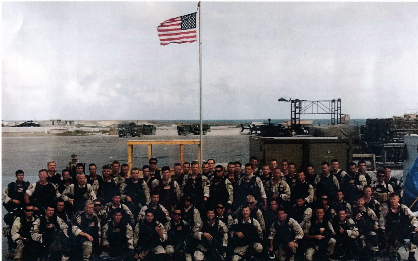
Групповая фотография Эскадрона "С" и подразделений обеспечения у ангара. Находящееся на виду оружие включает в себя 7,62-мм винтовки M14, дробовики 12 калибра Remington-870, CAR15 со смонтированными дробовиками Master Key, SAW M249 с выдвигаемыми прикладами и CAR15 с подствольными гранатометами M203. (Пол Леонард)